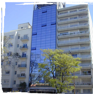
Edificio Gamma Tower.