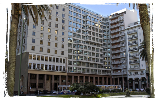
Edificio Plaza Mayor.